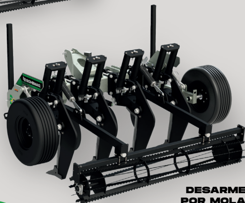
DESARME POR MOLA