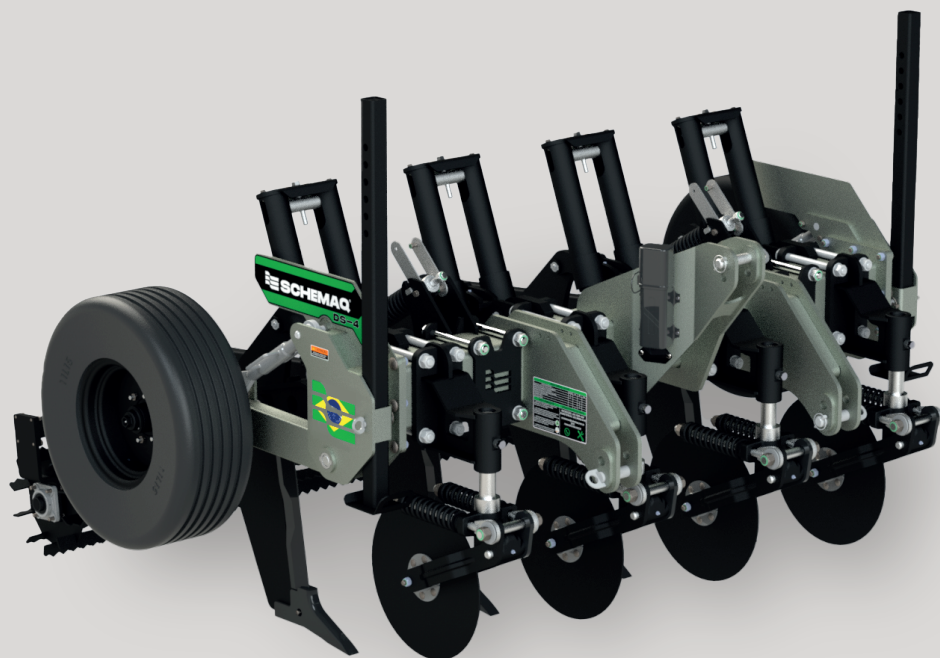
DESARME POR MOLA

i REALIZA A DESCOMPACTAÇÃO DAS CAMADAS MAIS PROFUNDAS DO SOLO.